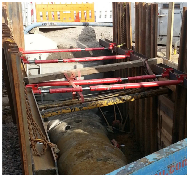
Gelsenkirchen, Steeler Straße